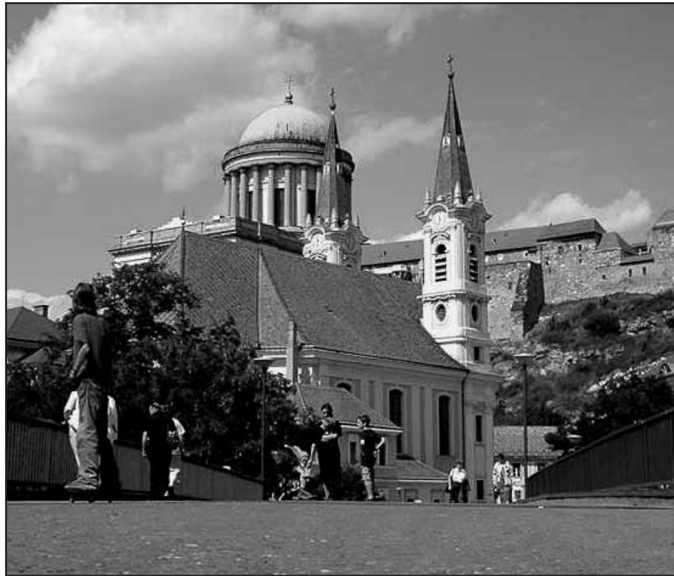
Vegyépszert Rt. vezetése és Szakszervezeti Intéző Bizottsága törődik nyugdíjasaival és ez évben sem maradt el a már évek óta hagyományos kirándulás.

A kiránduláson újabb barátságok kötődtek és megerősödtek a régié. Azt mindenki jó szívvel nyugtázta, hogy a