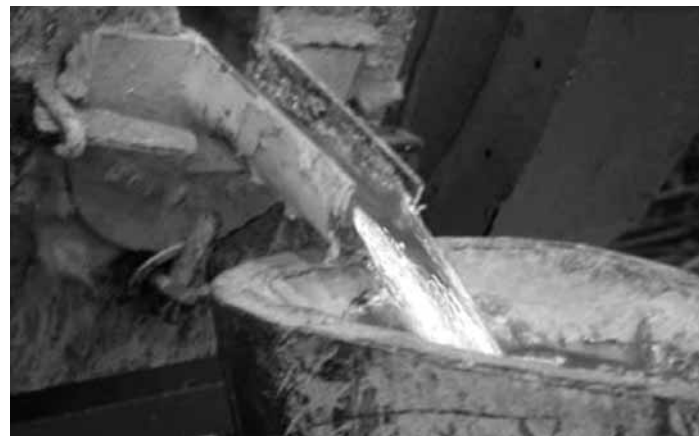
A Mal sikeres cég, kohászatát mégis megszünteti

Top 50-es listát állított össze a Veszprém megyében működő cégek elmúlt évi eredményei alapján a megyei kereskedelmi és iparkamara. Veszprém megyében több mint 34 ezer vállalkozás működik, ám a kiadványban szereplő 56 legnagyobb cég – az összes vállalat 0,17 százaléka –