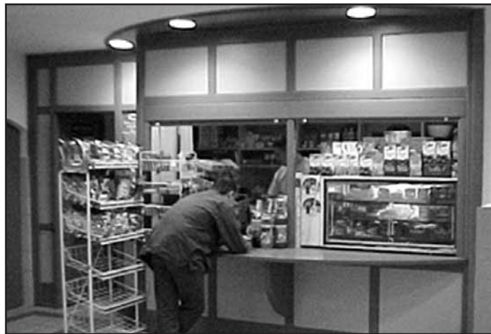
A tervek szerint az étkezési hozzájárulást is megadóztatnák

Szeptember elsejétől bevezetendő adókötelezettség miatt csaknem 17 százalékkal kerül többre a cégeknek az eddig adóköteles természetbeni juttatás. A törvénymódosítás értelmében 100 forint juttatás után már nem 76, hanem több mint 88 forint közterhet kell fizetnie a munkáltatóknak az államkasszába. A pénzügyi tárca ettől a lépéstől évi 8-9 milliárd forintos többlet bevételekre számít. Az adószakértők úgy vélik, hogy ez „egy övön aluli ütés a kormányzat részéről”, hiszen év közben növelik a foglalkoztatás terheit, miközben a kormány programjának ismeretében erre senki sem számított.