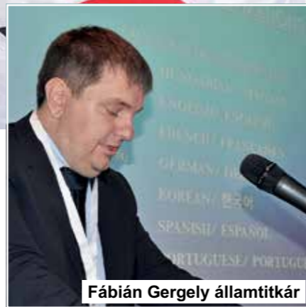
Fábian Gergely államtitkár