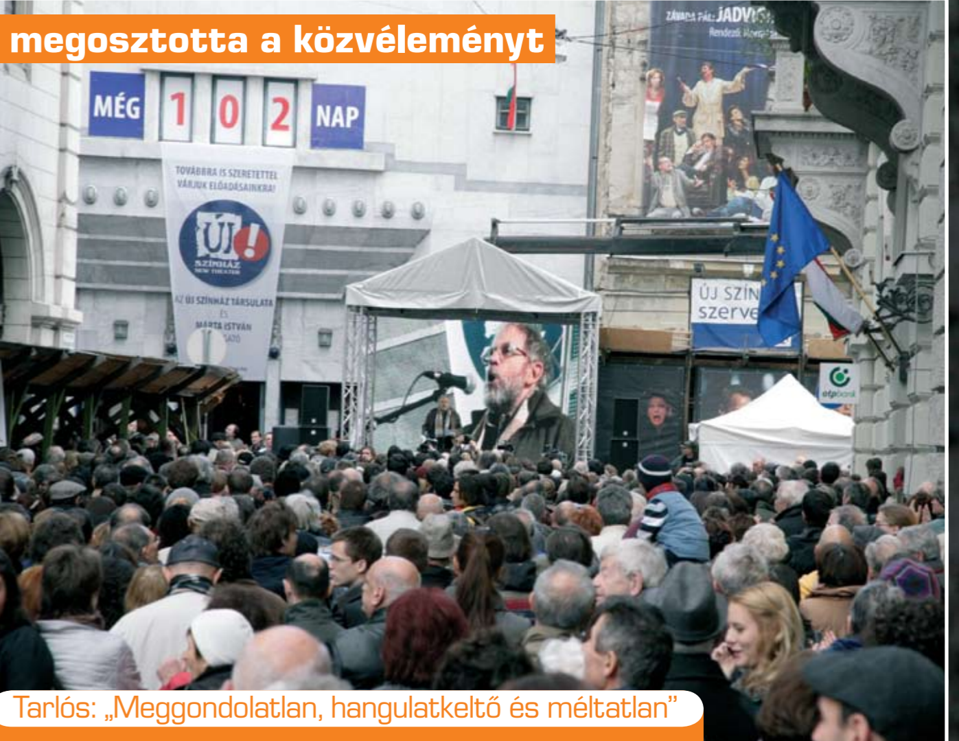
Tarlós: „Meggondolatlan, hangulatkeltő és méltatlan”