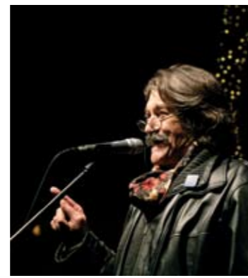
KÖNYVA: HALOTTI TOR A JOGÁLLAMISÁG FELETT

Ahogy az óév kormányellenes tüntetéssel fejeződött be, úgy indult 2012 is. Január 2-án több tízezer tüntetett az új alaptörvény ellen az Andrassy úton, amelynek életbelépését éppen akkor ünnepelte a kormány az Operaházban. Szélsőjobboldaliak viszont a civilek ellen tüntettek ugyanott: a Nagymező utcánál árpádsávos zászlókkal felvonuló ellentüntetők lökdösődésbe keveredtek szocialista politikusokkal. Orbán Viktor és Schmitt Pál az Operaház hátsó bejáratán keresztül távozott.