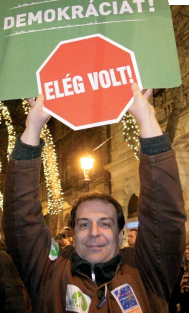
KUN J. ERZSÉBET

A demonstráció után a tömeg egy része az Opera elé vonult, ahol a tüntetők egybebeszéltek, valamint „Gyertek ki!” skandálással adtak hangot az elégedetlenségüknek.