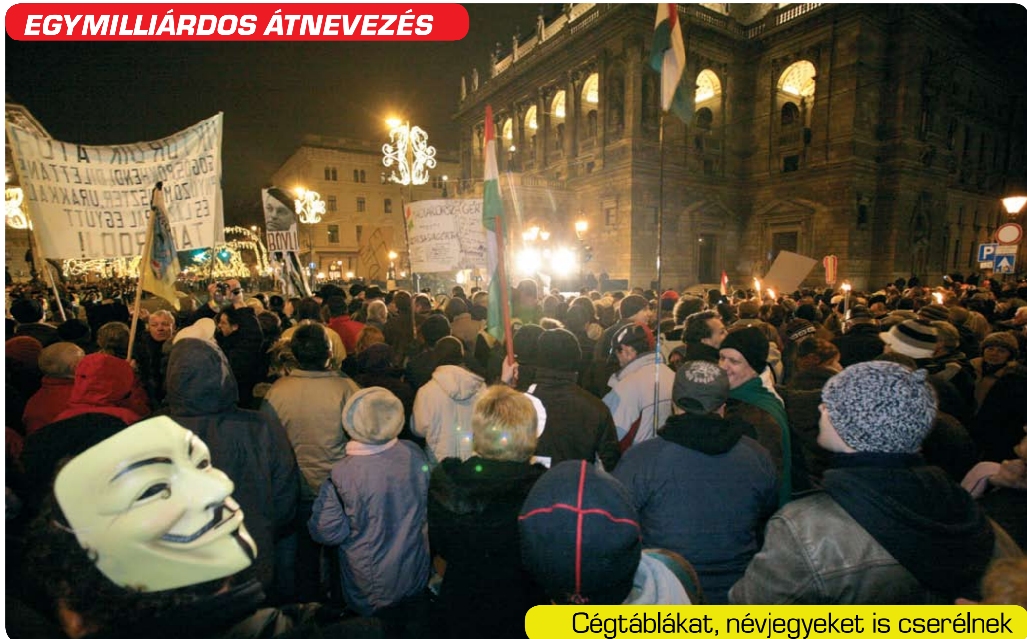
Cégtáblákat, névjegyeket is cserélnek