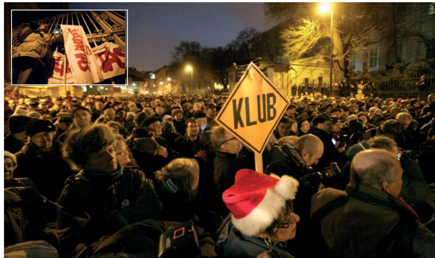
tek össze a sajtószabadságot követelők, amikor kiderült: februártól megszűnik a baloldali értékeknek is nyilvánosságát adó Klubrádió. (KUN J. ERZSÉBET)

A mára több mint tízezres tagságúra duzzadt Szolidaritás és más civil szervezetek hívó szavára az év utolsó heteiben tízezrek gyűltek össze több alkalommal, hogy tiltakozzanak a kormány cinikus magatartása, intézkedéseinek következményei ellen, azt követelve, hogy a kormány egyeztessen a munka világát érintő kérdésekről a munkavállalók képviselőivel. A Klubrádió megszűntetése ellen is ezek demonstráltak.